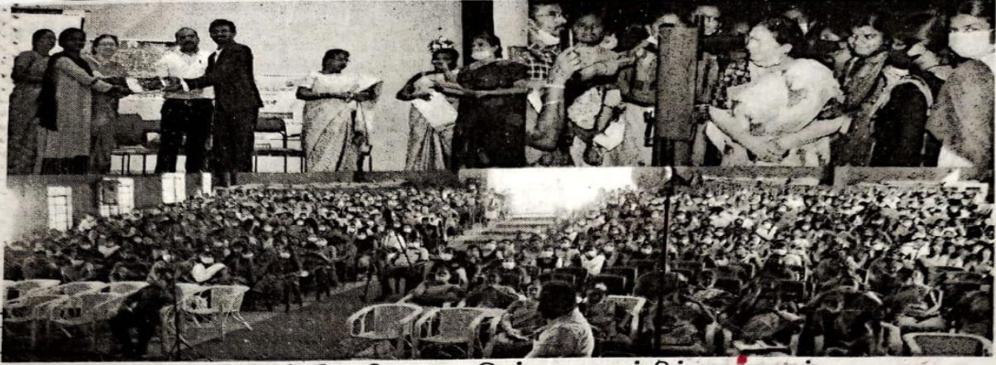
அறிவியல் திருவிழா நடைபெற்றதை படத்தில் காணலாம்.

உடுமலை ஜி.வி.ஜி. விசாலாட்சி மகளிர் கல்லூரியில்