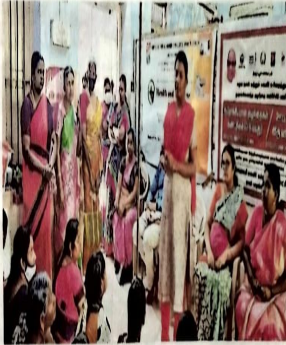
பெரிய வானவாடி ஆரம்ப சுகாதார நிலையத்தில், உலக சுகாதார தினம் கொண்டாடப்பட்டது.